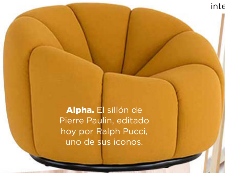
Alpha. El sillón de Pierre Paulin, editado hoy por Ralph Pucci, uno de sus iconos.

Majadahonda. Uno de sus últimos proyectos de interiorismo en la capital.